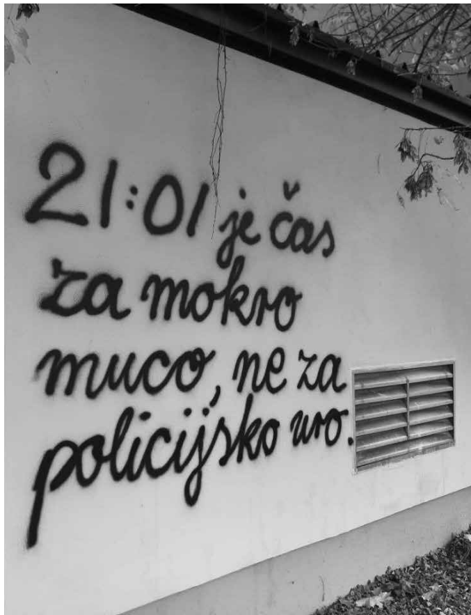
odgovor na POLICIJSKO URO, Ljubljana, 2021

no pasaran pripadamo plemenu z imenom poiesis no pasaran ne bojte se, zločinci, tudi vas čaka usoda samomorilca tamle vaš dohtar že pripravlja brizgo z zadnjo dozo eukodala papa