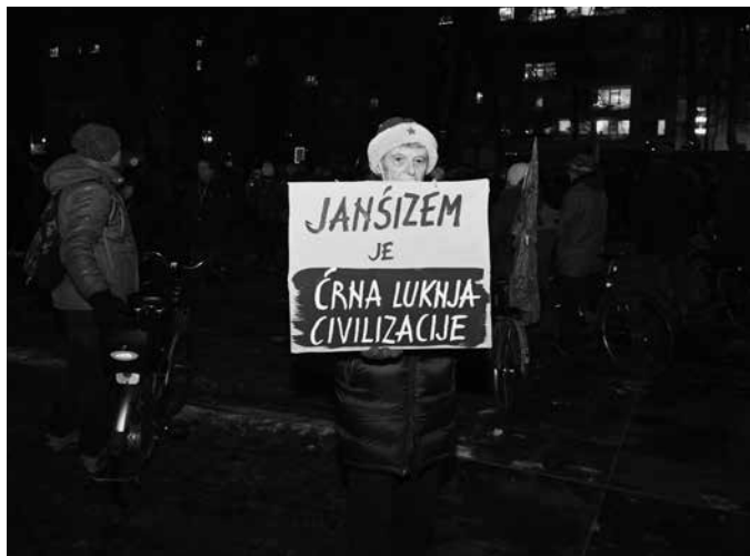
1. 7. 2022, TRG REPUBLIKE, Ljubljana PROTESTNI TRANSPARENT