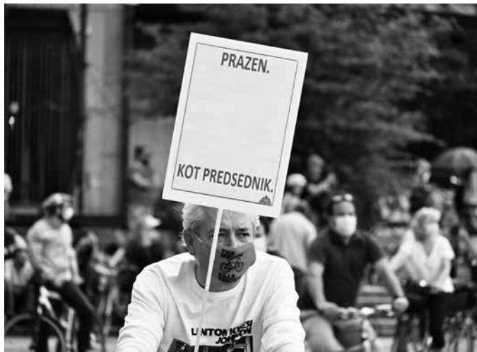
11. 6. 2021, TRG REPUBLIKE, Ljubljana PROTESTNI TRANSPARENT