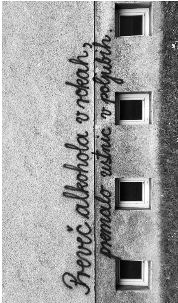
odgovor na POLICIJSKO URO, Ljubljana, 2021